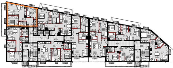
PARTER LOKAL NR 2 pow. użyt. 66,65 m 2